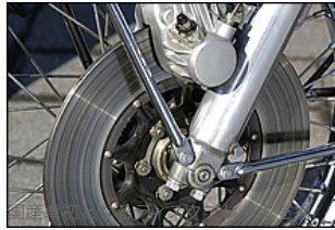
用。モーターショー発表時は、モックア