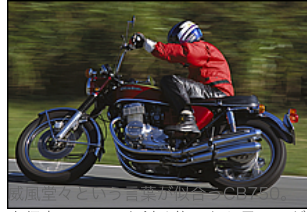
走行中のマシンを斜め後ろから見るのが