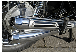
クターが付く。K0のみ特殊メッキ処理