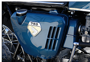
ンプレムはK0の特徴。足付き性が悪いた