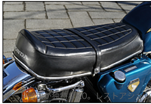
フなどからシートレザーが販売されてお