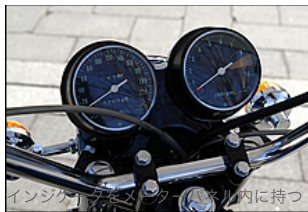
インジケータースタックがハンドル内につ