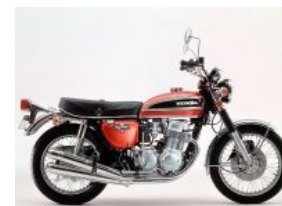
ホンダ DREAM CB750 FOUR | ドリーム CB750フォア